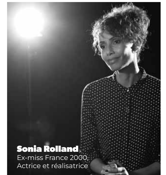
Sonia Rolland Ex-miss France 2000, Actrice et réalisatrice