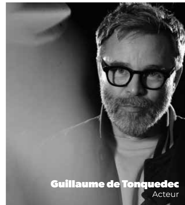
Guillaume de Tonquedec Acteur