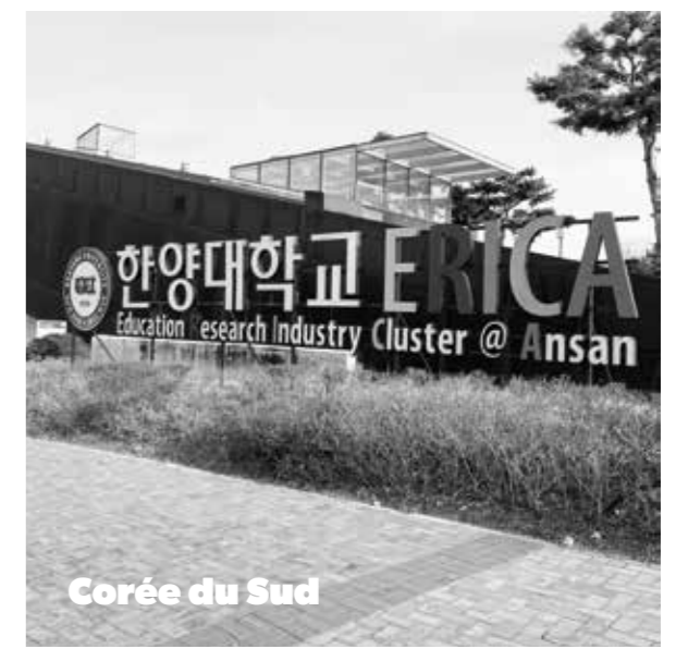
Corée du Sud

Les programmes ABROAD, c'est faire des études à l'international et une alternance la même année. Les étudiants partent de septembre à décembre et intègrent l'école en rentrée décalée de février. Puis ils commencent leur programme MSc en alternance (20 mois). Une façon de multiplier leurs expériences sans perdre de temps !