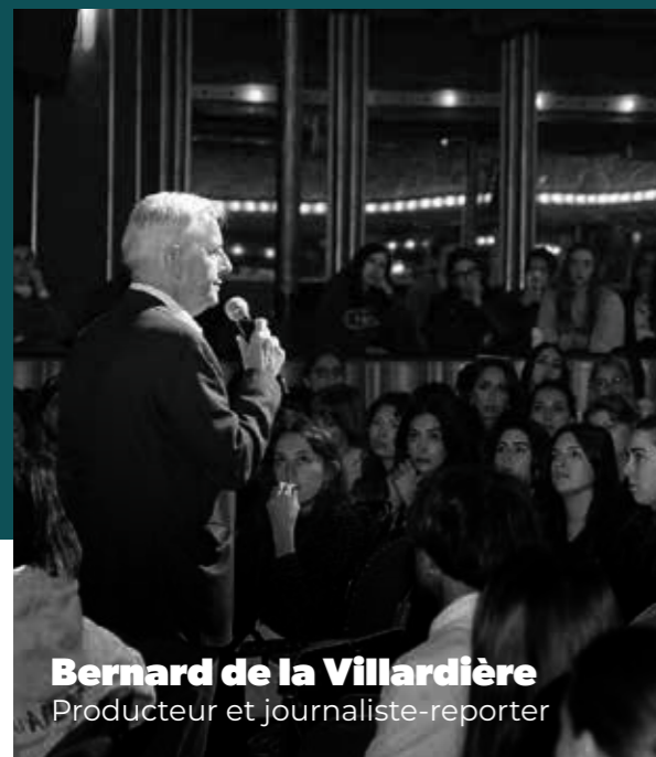
Bernard de la Villardière Producteur et journaliste-reporter