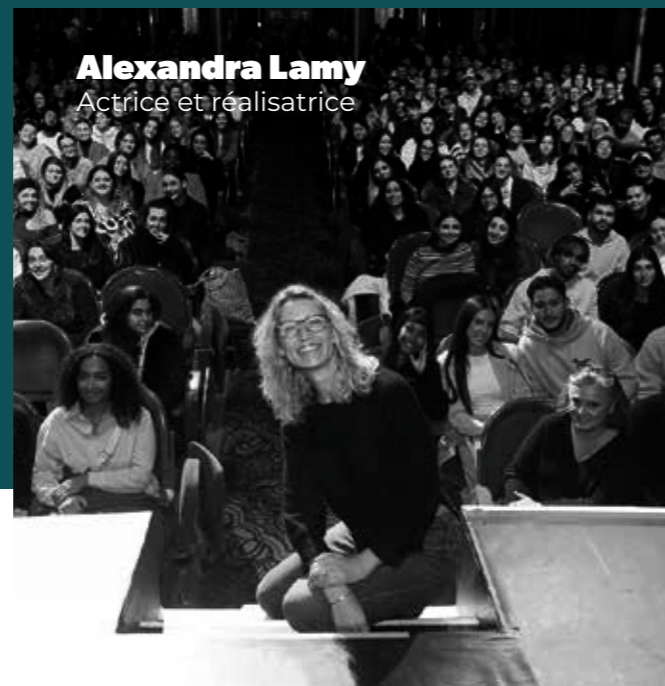
Alexandra Lamy Actrice et réalisatrice