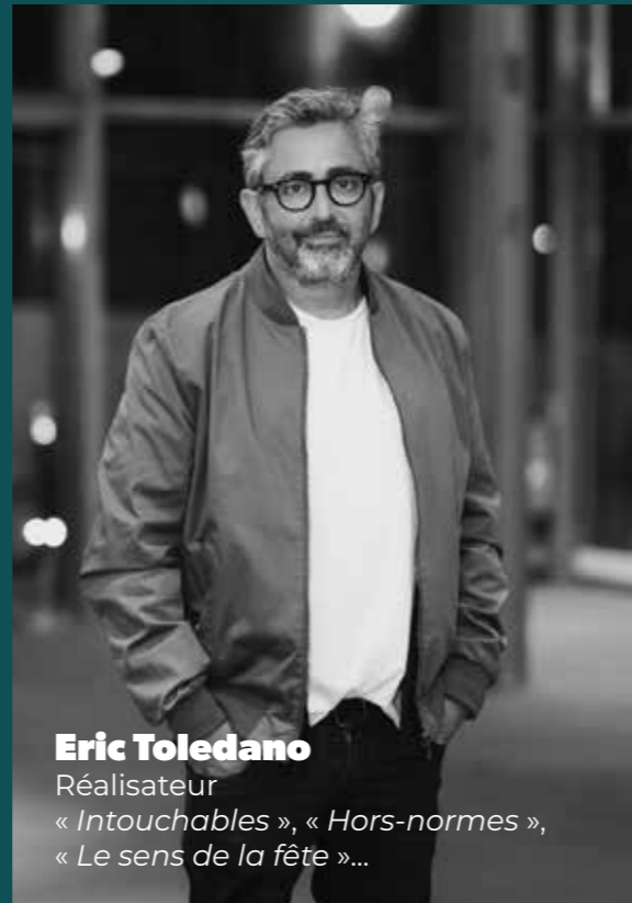
Eric Toledano Réalisateur « Intouchables », « Hors-normes », « Le sens de la fête »...

Stars de cinéma ou des médias, personnalités politiques, entrepreneurs à succès et grands communicants ont tous en commun la transmission aux étudiants de leur expérience et expertise.